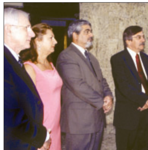
Diretores da Fenep com representantes

lidades escolares, o deputado federal Paes Landim (PTB/PI) disse que o governo deveria estimular as boas escolas, criando incentivos fiscais e mecanismos de proteção contra a inadimplência. “A escola particular preenche uma lacuna altamente importante em nosso país. Por isso, o Estado deveria contribuir para que as escolas se mantenham vivas”, argumentou.