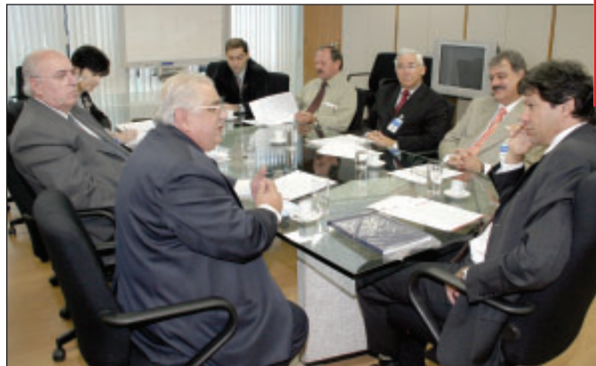
Reunião no MEC com o Ministro Fernando Haddad

A gestão da atual diretoria da Fenep foi marcada por uma busca incessante pelo diálogo franco com os diversos setores da sociedade. A Federação participou de vários projetos e campanhas do Governo Federal em benefício da educação brasileira. Na esfera da política, a entidade tem buscado o diálogo para resolver alguns dos principais problemas do setor, como a inadimplência e a excessiva carga tributária que impedem a sobrevivência das escolas.