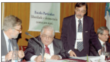
Cerimônia de assinatura de acordo com a Embaixada da França

• A Federação Nacional das Escolas Particulares é o único organismo nacional que tem participado com a República Popular da China da expansão de um “modelo privado” para gestão pública de educação.