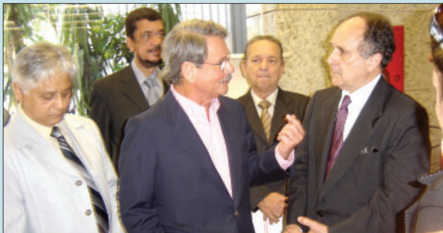
Presidente do Sinepe Rio e o Senador Cristovam Buarque conversam durante evento

O Senador Cristovam Buarque (PDT/DF) destacou a importância da escola particular, ressaltando que atualmente o setor garante educação a 7 milhões de crianças e jovens que não recebem na escola pública ensino de qualidade. “O ideal é que tenhamos 48 milhões de crianças nessas condições, e, para isso, tem que ser na escola pública. Mas, felizmente, temos a escola privada preenchendo a lacuna do setor público”, afirmou Cristovam Buarque.