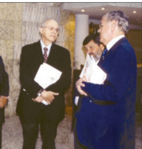
do Senado e da Câmara dos Deputados